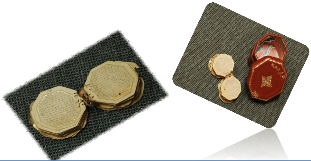
Coran de forme microscopique de forme octogonale doré sur tranche executé dans un très joli neskhî persan entièrement vocalisé écrit en 1016 de l'ègîre .